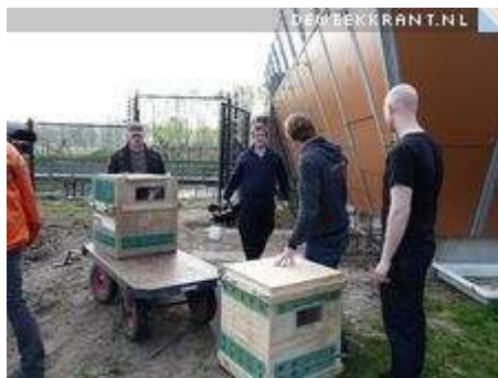
De apen komen aan bij Stichting Aap

Nadat ze jarenlang ten dienste van de mensheid neurologische tests hebben ondergaan op de Universiteit Utrecht, mogen de rhesusapen Bassie en Adriaan en Appy, Puyi en Chang vanaf vandaag gaan genieten van een welverdiend pensioen. In 2007 besloot de UU om op universiteitsterrein De Uithof vanaf 1 januari 2011 geen primaten meer te gebruiken voor dierproeven.