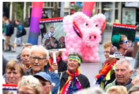
Leden van vakbond Abvakabo FNV demonstreerden afgelopen vrijdag op het Spui in Den Haag tegen de afbraak van pensioenen.

De Pensioenfederatie dringt er bij Klijnsma ook op aan dat de fiscale regelgeving – het zogenoemde Witteveenkader – 'een goede pensioenopbouw niet in de weg staat'. Dat wetsvoorstel ligt momenteel in de Eerste Kamer, maar dreigt begin oktober te worden weggestemd. Met dat wetsvoorstel wordt de grens waarin belastingvrij pensioen kan worden opgebouwd, verlaagd. Dat moet leiden tot een bezuiniging van 3 miljard euro. Die wet heeft consequenties voor het nieuwe ftk, stelt de federatie, die zich daarom verzet tegen verlaging van de pensioenopbouw. (RvdD)